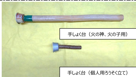
手しよく台 (火の神、火の子用)