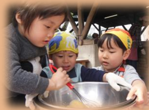
いろいろな体験をサポートします！