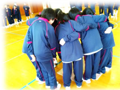
仲間づくりゲームの様子