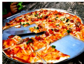
アツアツのピザを仲間と一緒に

野外炊飯は、きみかめの人気プログラムで、中でも『ドラム缶ピザ&スープづくり』は、小学生のいる団体に人気があります。自分たちの手で粉から生地を仕上げ、もちり生地を野菜、ウインナー、チーズで彩ります。生地の形に決まりなんてありません！動物やキャラクターの形にする子どもたちもいます。創作意欲も湧きますね。