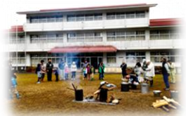
環南みんなの楽校