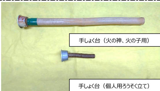
手しよく台 (火の神、火の子用)